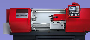
EMCOMAT-E300/360/400 with Siemens or Fagor