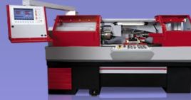
EMCOMAT-E200 with Siemens or Easy Cycle