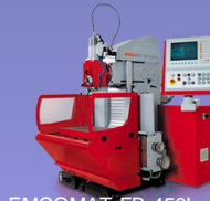
EMCOMAT FB-450L Heidenhain or Easy Cycle