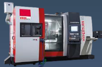
HYPERTURN 65 PM