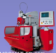
EMCOMAT FB-600L Heidenhain or Easy Cycle