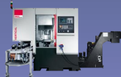
EMCO VERTICAL VT 160, 250, 400